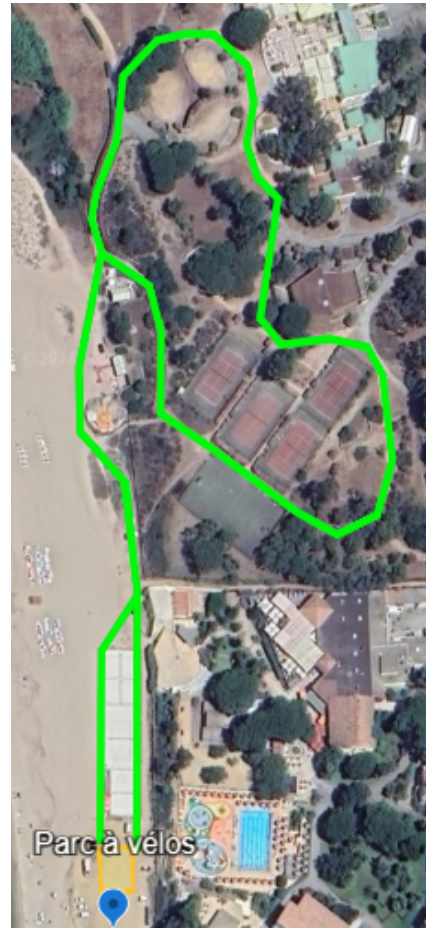
PARCOURS VERT - 1 KM